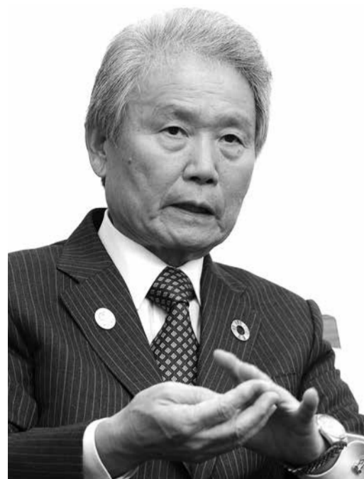
榊原定征氏 日本経済団体連合会会長・ 2025 日本万国博覧会誘致委員会会長

健康診断や、その結果をビッグデータを駆使して分析し予防につなげる取り組みなどは新たな産業のきっかけにもなるでしょうし、万博が良いアピールの場になると思います。