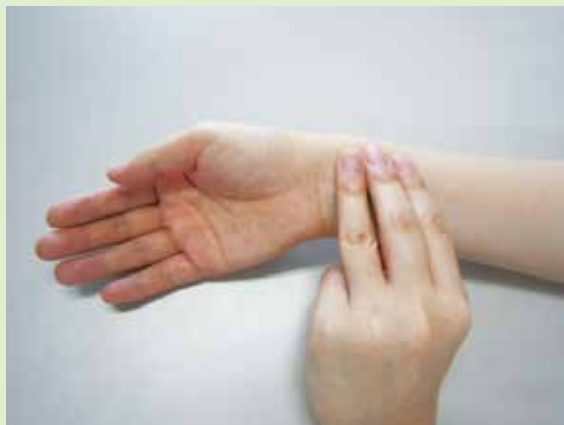
脈拍のとり方とリズム