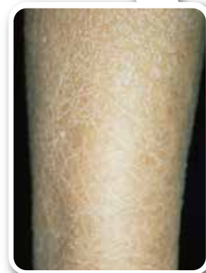
高齢者の乾燥肌 (老人性乾皮症)

また、角質層の表面には毛穴から出てくる油分(皮脂)と水分が混ざってできる皮脂膜があり、水分の蒸発を防いでいます。角質層の細胞にはアミノ酸などの天然保湿因子があり、細胞間にあるセラミドなどの脂質も水分を蓄える役割をしています。水分保持に役立つアミノ酸やセラミドは、年齢を重ねると徐々に減少してきます。